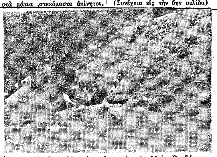
Παναγία Σουμελά : τό νερό κοντά στην Άγία Βαρβάρα.

Τίποτε δέν έχουμε να δούμε παρά μόνο τό άγίασμα στη μέση του χώρου και τό ναίδειον στο βάθος της σπηλιάς, κάτω από τη φυσική θολωτή στέγη του.