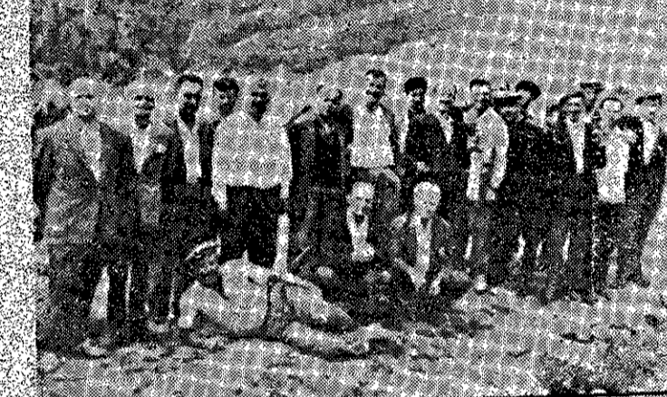
Επιστροφή από την Ζύγανα

Ιερά Ποντιακή Ίδέα, όσον καί ή τοιαύτη του ένδοξου ήμων Έθνους. Τά χρόνια παρέχονται κα- άντι να άφομοιωθούμε, άπο- μοιωόμε και συμβαίνει ταύτο με τους έν Έλλάδι πρόσφυγας και γηγενείς, το θαυμάσιον λε- γώ φαινόμενον ότι ύπάρχει πλήρης άναγνώρισις Ιουμμετα- κής εις τό. Πανεθνικόν έκείνο κένθος, της άπωλείας δηλονότι του άλησμονήτου Πόντου και έρχεται παρήγορος ή συμπαρά- στασις των άναφερθέντων άδελ- φών μας εις όλους τας έκδη- λώσεις της ζωής μας. Ότιω οι ποταμοί του Πόν- του εκβάλλουν σήμερον εις θα- λάσσαν της αιωνίας Έλλάδος, εις την όποιαν θάλασσαν όφεί- λουσιν άλλωστε και τα ρεύθη των. Η λύρα μας, τα τραγούδια μας, τα ήθη και έθιμα μας και αί παντοειδείς καλλιτεχνικά και έκδηλώσεις αποτελούν το ούρον νον νέκταρ, με το όποιον τρε- φόμεθα άναζωογονούντες τας δυνάμεις μας. Άποτέλουν ίδι- αίτερος και την ιδιόεξουσίαν καύσιμον ύλην κινητοποίησης των έθνικών μας λεβήτων, έδώ εις την έλευθεράν πατρίδα, την αιωνίαν Έλλάδα μας».